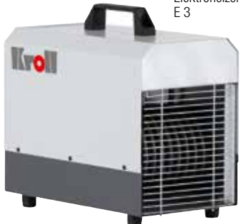
Elektroheizer E 3