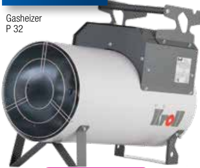
Gasheizer P 32