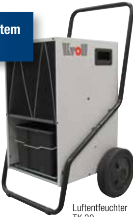
Luftentfeuchter TK 30